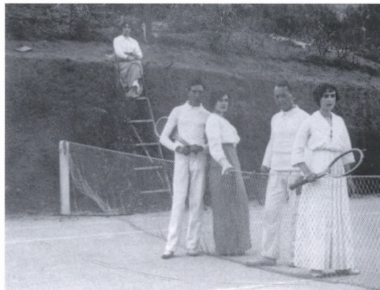
Els jugadors i l'àrbitre abans d'iniciar el matx