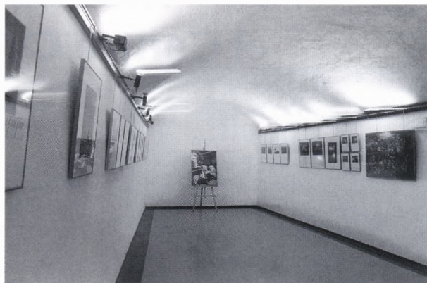
Un aspecte de l'exposició.

El Centre Cultural Escoles Velles de Begur ha acollit del 13 de febrer al 2 de març l'exposició de fotografies, patrocinada pel Consell Comarcal del Baix Empordà, «Mediterranostra. Visions del Baix Empordà», que recull diverses obres dels fotògrafs Quim Tor, Eduard Punset i Josep Capellà. Tal com escriu el fotògraf Paco Ontañon en el programa de mà que acompanya l'exposició, «Poques vegades tenim l'oportunitat de veure en conjunt el treball de tres fotògrafs diferents i que el resultat sigui aquest complex harmònic de la mostra fotogràfica "Mediterranostra". A les mirades perdudes i significatives de Josep Capellà, a les conceptuals pedres i flors d'Eduard Punset i a la rica varietat d'escenes de Quim Tor hi van afegits una tècnica depurada i un sentit de la imatge i la composició