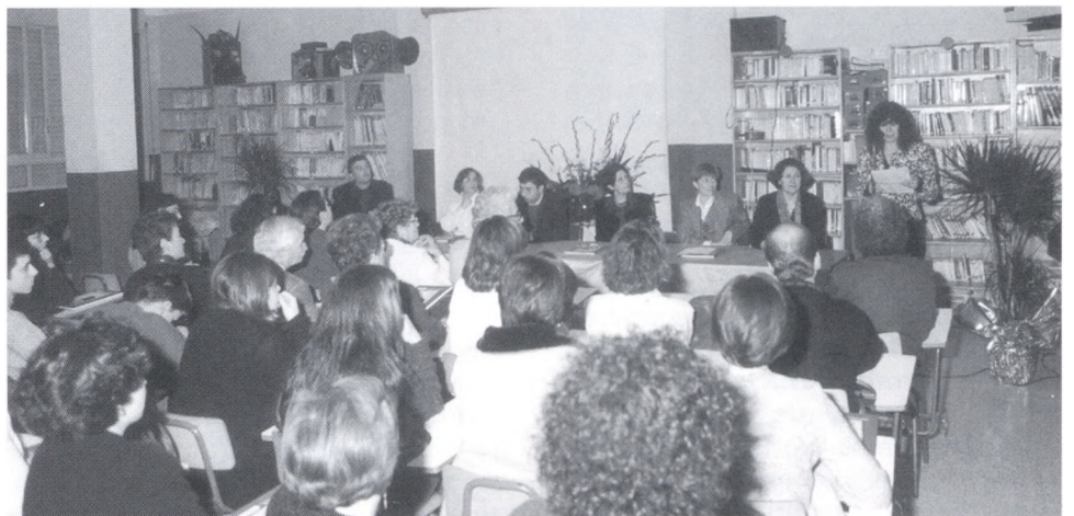
Acte de presentació del llibre.