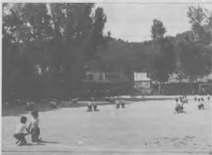
Taula gimnàstica de la gent menuda.