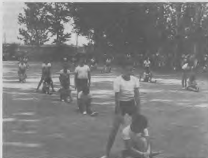
Taula gimnàstica de nenes de 5.è, 6.è i 7.è