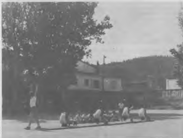
Aquí va de cap-bussons. Però amb quin estil