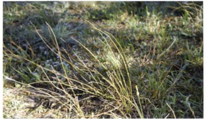
Trompetera ( Ephedra distachya ).

Arbust d'entre 20 i 30 centímetres d'alçada, és propi dels ambients de sorra i a l'espai es troba en un petit enclavament al voltant de la zona dunar sobre la platja del Bol Roig. Es tracta d'una espècie rara al conjunt de Catalunya. Pertany al grup de les gimnospermes (com els pins), les quals que es caracteritzen per produir llavors però no fruits, agrupades en pinyes o estructures semblants. Conformava l'hàbitat "Dunes establitzades amb comunitats de Crucianella marítima , Ononis natrix subsp. ramosissima (gavó mari), Thymelaea hirsuta (bufalaga marina)..., de les platges arenoses" el qual també es considerat d'interès comunitari per la Directiva hàbitats (92/43/CEE). La presència de diversos camins que travessen o voregen el rodal present i el trepig n'esdevenen actualment les principals amenaces.