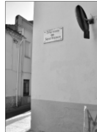
La làpida a la paret de la casa número 1 i a l'esquerra el carrer d'Àngel Guimerà.

amb el carrer de Sant Ramon del qual n'està bastant allunyada. El nom que li correspondria és el del carrer on ella comença, o sia el d'ÀNGEL GUIMERA i, en conseqüència, dir-se "TRAVESSIA D'ÀNGEL GUIMERA". Aquest és el nostre parer i pel fet d'haver-hi nascut crec que tinc el dret de donar la meua opinió.