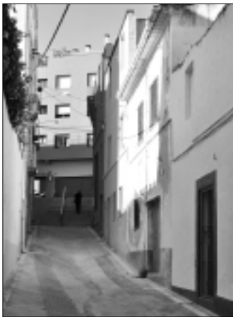
Detall de la travessia on s'hi aprecia l'escalinata al fons.

Quan Sant Feliu anà creixent, ja algun segle enrere, es formà, entre altres carrers, el de SANT RAMON a partir del Portalet. Anys després el de Sant Ramon donà origen a un altre carrer al qual va aplicar-se la denominació de NOU DE SANT RAMON sense haver de rumiar gaire per batejar-lo. Poc temps més endavant s'obrí una altra via secundària que anava des del Nou de Sant Ramon al de la Processó i li fou aplicada la denominació de Travessia de Nou Sant Ramon.