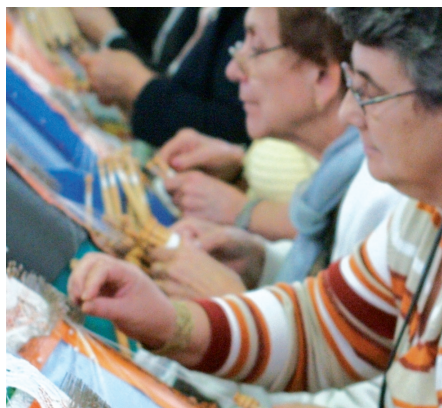
Les puntaires: fil, patrons, agulles i boixets.