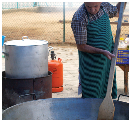
Fent el sofregit d'un arròs per a tres-cents comensals.