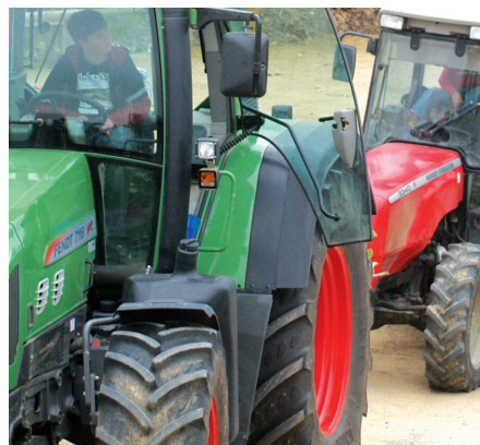
Tractors al carrer de Girona, abans de la desfilada.