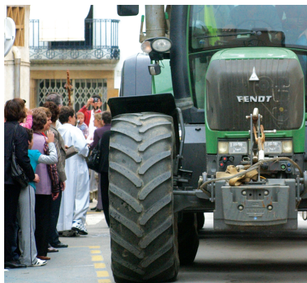
Aspecte de la plaça Vella durant la desfilada de tractors.