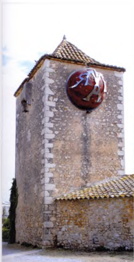
La torre del mas Vicenç dels Recs, de planta quadrada i teulada a quatre vessants.