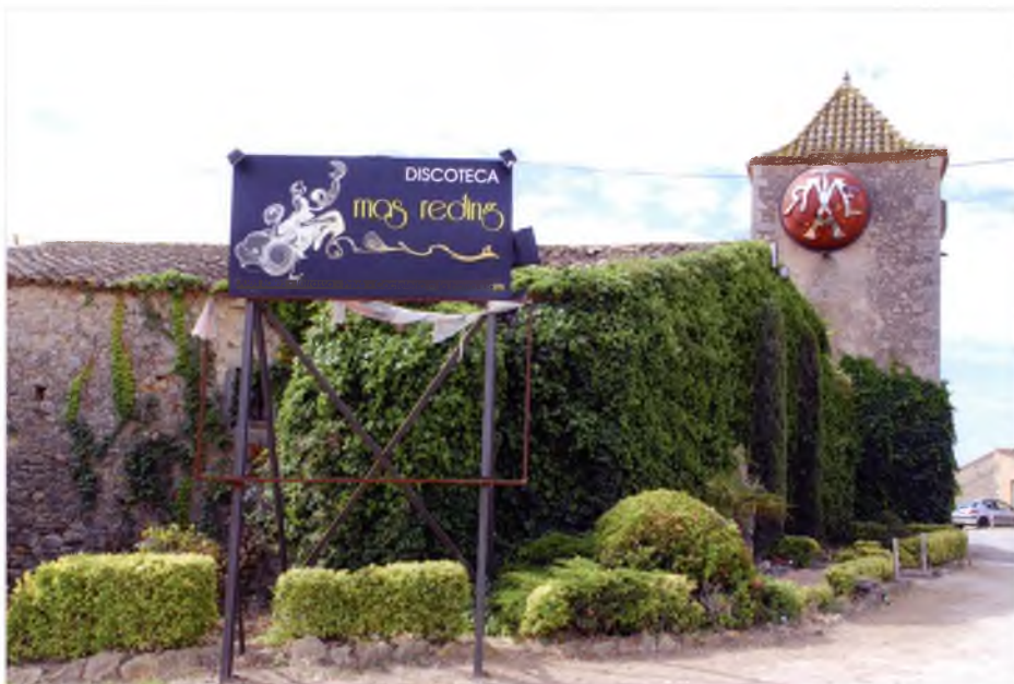
El mas Vicenç dels Recs, can Reding, actualment transformat en una discoteca.