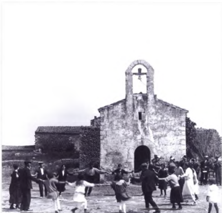
Ballada de sardanes davant de Santa Reparada de Cinclaus, possiblement l'any 1922, quan l'escriptora Víctor Català va instituir l'Aplec de Santa Reparada.