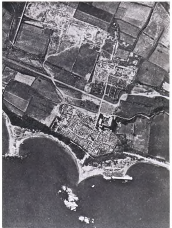
Fotografia dels anys 50 amb les traces de la bateria de canons.

De lo que parlaren, sols es diu que quedaren entesos per a construir les obres per a instal·lar les bateries de canons en la citada finca Nº16, situada mes al costat Est del terreny Nº12 que fou el que prengueren mesures anteriorment. Dits senyors no ens digueren res ni (Salut;) per tant ens amb