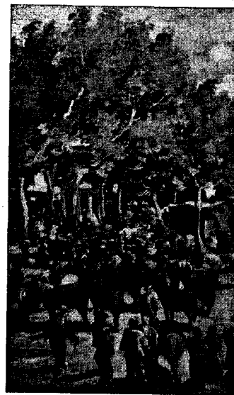
Fires de Sant