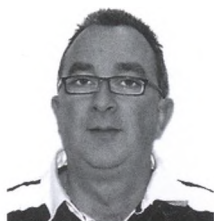
Jordi Bruguera Batalla

L'any 1972 s'iniciaren els estudis per a la construcció del Port Esportiu de l'Escala i l'any 1974 s'aprovaria el projecte de construcció de la nova dàrsena esportiva que no es comença a executar fins l'any 1979, tal com queda mostrat en la foto d'aquest any, de Joaquim Palau, en què dos operaris del Club Nàutic instal·len el cartell en la zona on finalment es construirà.