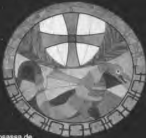
Nova rosassa de