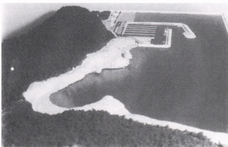
Imatge del port de Begur. En primer terme la platja de la Riera. (Fotografies de la maqueta.)

relacions i els compromisos contrets amb l'empresa adjudicatària, podrien ser coberts per molta gent del poble, amb l'avantatge afegida que aquesta feina pot durar diversos anys.