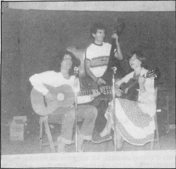
Guanyadors del III Concurs de Cançó.

llavis per humitejar-los i es va empassar la poca saliva que tenia a la boca. Va inspirar profundament i va dir: "Podríem fer un concurs de cançons amb la mainada del poble".