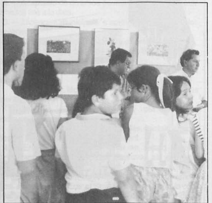
Inauguració de l'exposició als baixos de l'ajuntament.