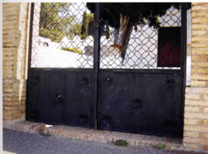
Porta d'entrada al cementiri d'Empúries, on encara avui es poden observar diversos forats de bala.