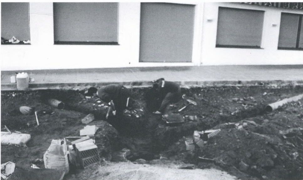
Millores en el clavegueram de Sa Riera.