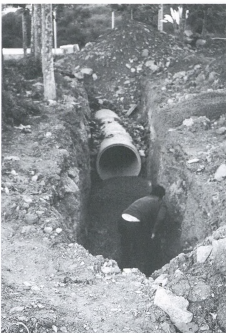
Arranjament del clavegueram del Sot d'en Ferrer.