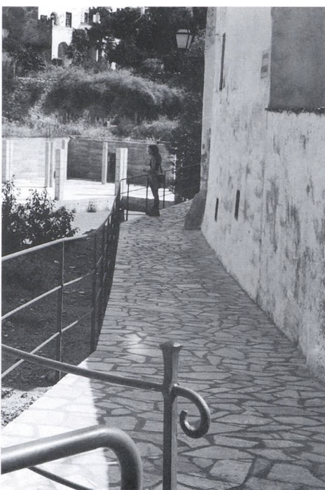
Remodelació del carrer Font de Baix.