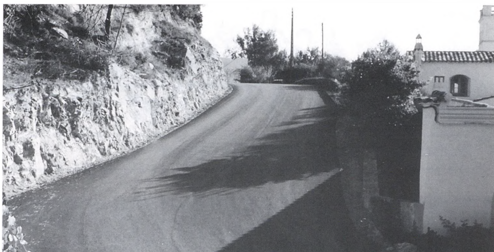
Eliminació del coll d'ampolla de la carretera del Convent de Santa Reparada, direcció al Mas Mató.