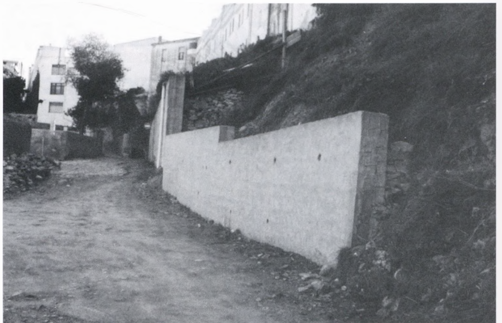
Mur de contenció a la Font de Baix (subvencionat per la Diputació).