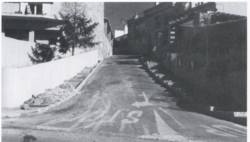
Remodelació del carrer Raval.