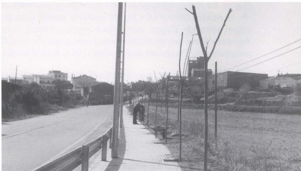
Carretera d'Esclanyà. Plantació de moreres i sòfores a les voreres del passeig d'Esclanyà a Palafrugell.