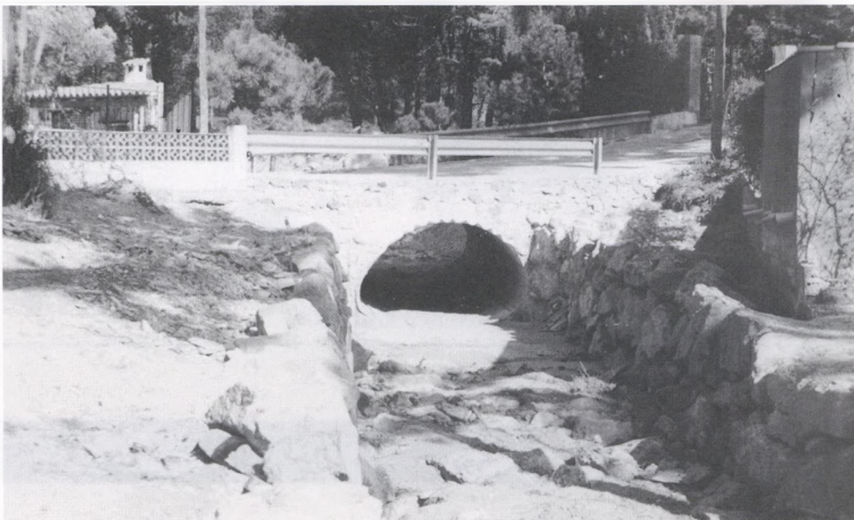
Riera de Salt Ses Eugues. S'han realitzat treballs de protecció de la riera i s'ha construït un nou pont.