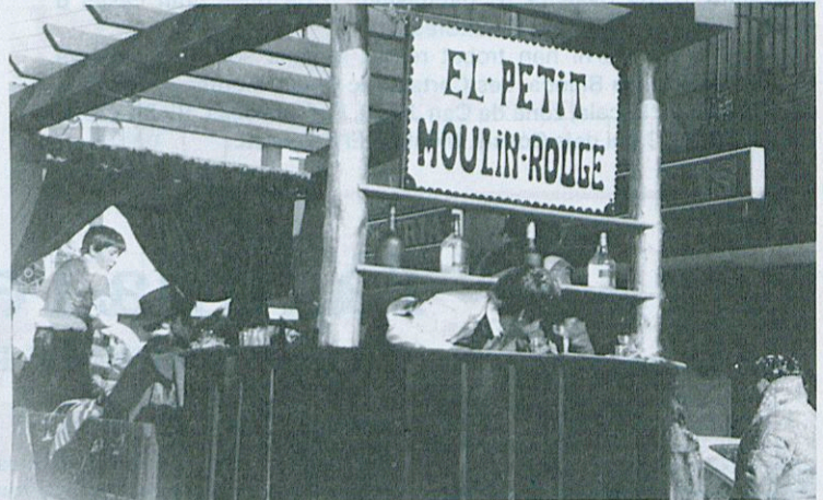
2.º Premi del Concurs de Carrosses.