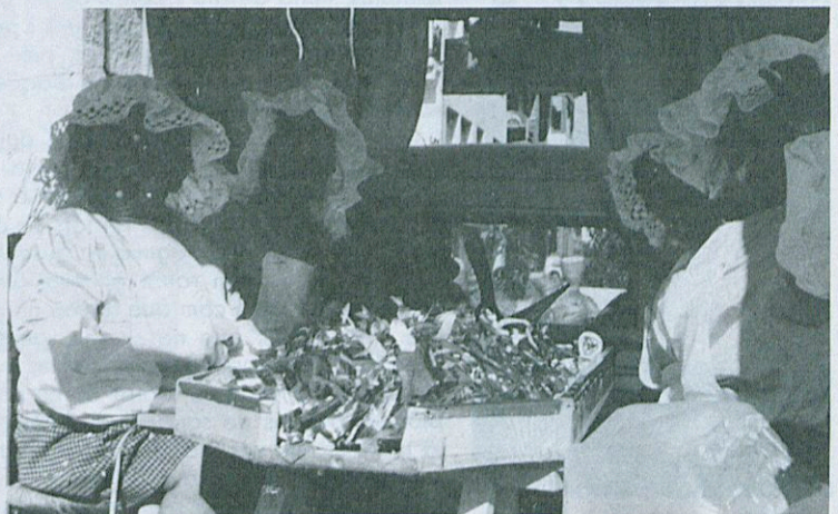
3.º Premi del Concurs de Carrosses.