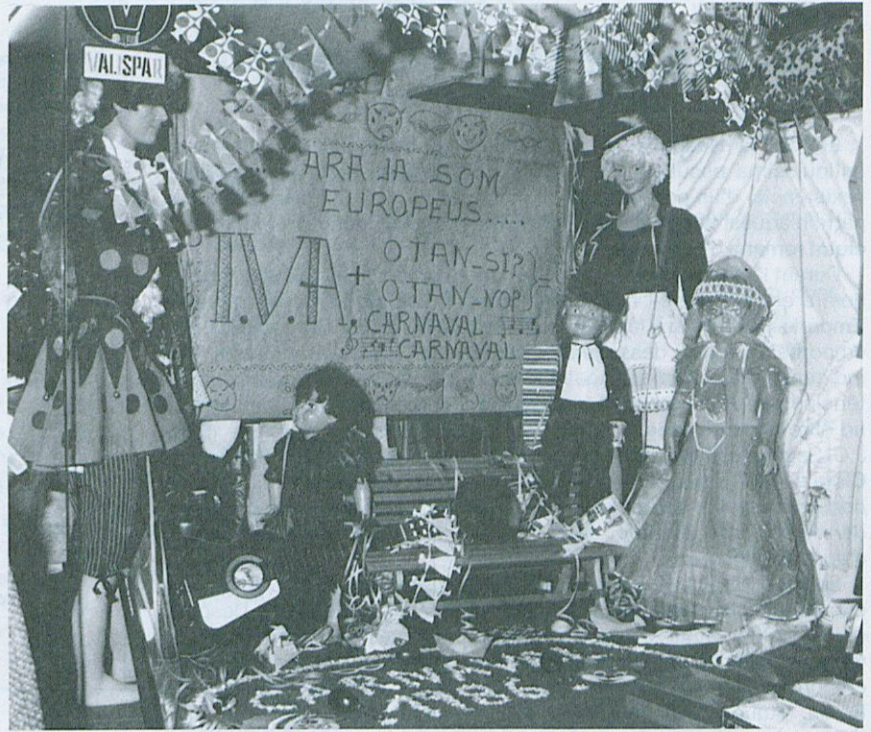
1.º Premi del Concurs d'aparadors