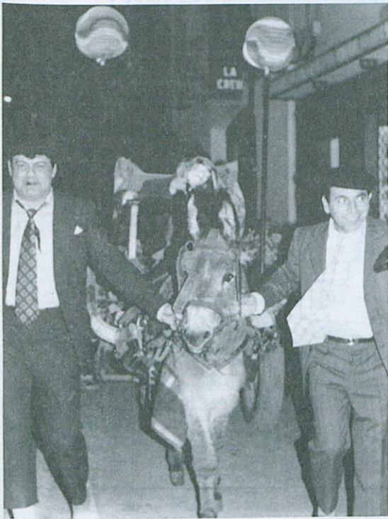
Arribada de Carnestoltes.