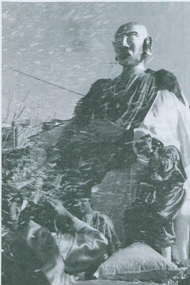
1.º Premi del Concurs de Carrosses