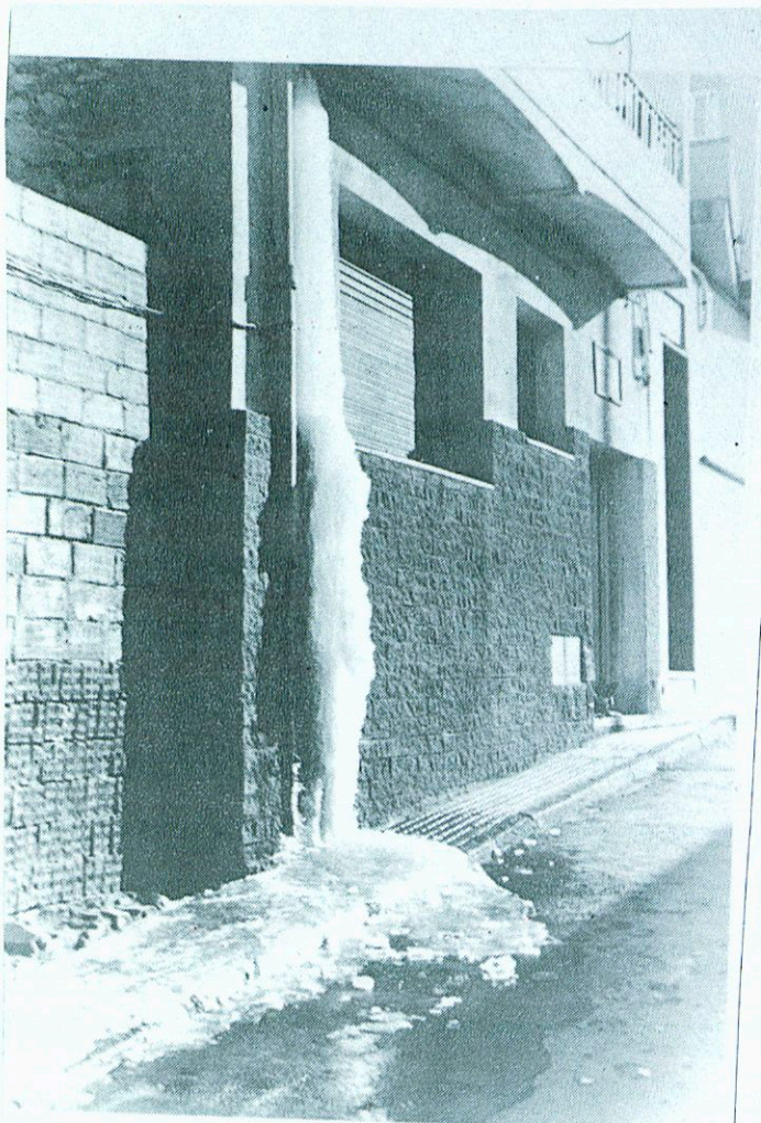
Les baixes temperatures rebentaren innumbrables canyeries, obsequiant-nos amb insòlits espectacles com el de la foto.

Ens comunica l'amic Jonàs Mallart que, segons l'observatori de La Clota, s'ha arribat a unes temperatures de -7.0^{\circ} de mínima, 4.0^{\circ} de màxima, amb una mitja de 0.0^{\circ} en els darrers dies de desembre i primers de gener. Per la seva banda, la tramuntana ha arribat als 100 km. hora en moltes ocasions.