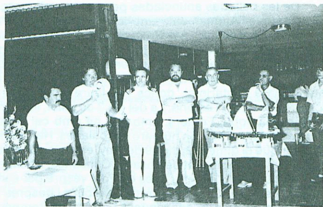
El dia 6 de juliol va tenir lloc, a la terrassa del restaurant Marinada, el lliurament dels premis corresponents a la II Mediterrània Hòbie Fun, Amposta - l'Escala. Moment del lliurament de premis.