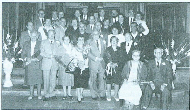
Aquests són els matrimonis que enguany han commemorat conjuntament les Noces d'Or i les Noces d'Argent.

Sembla ésser que tot va anar molt bé i, per tant, no ens resta més que felicitar totes les parelles que commemoraren conjuntament l'aniversari dels 50 i 25 anys de matrimoni, respectivament, i la relació de les quals és la següent: