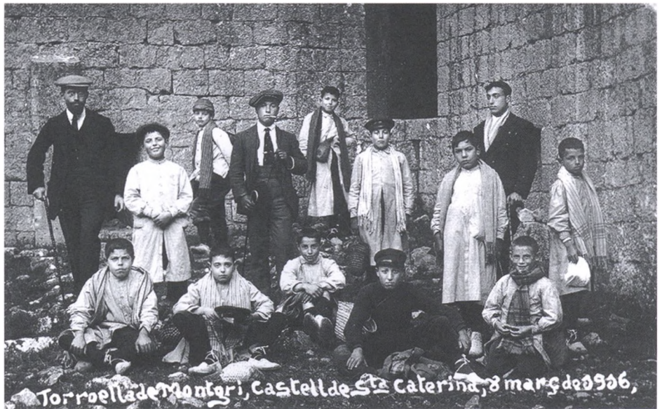
Sortida feta el 8 de març del 1916.

S'aplicarien aquests trets generals d'acord amb el que l'article 5 del Reglament intern de centre afirmava: <<Para hacer la enseñanza más práctica y agradable se realizarán paseos escolares al campo, a las fábricas y a otros sitios apropiados para la instrucción de los niños.>> 32