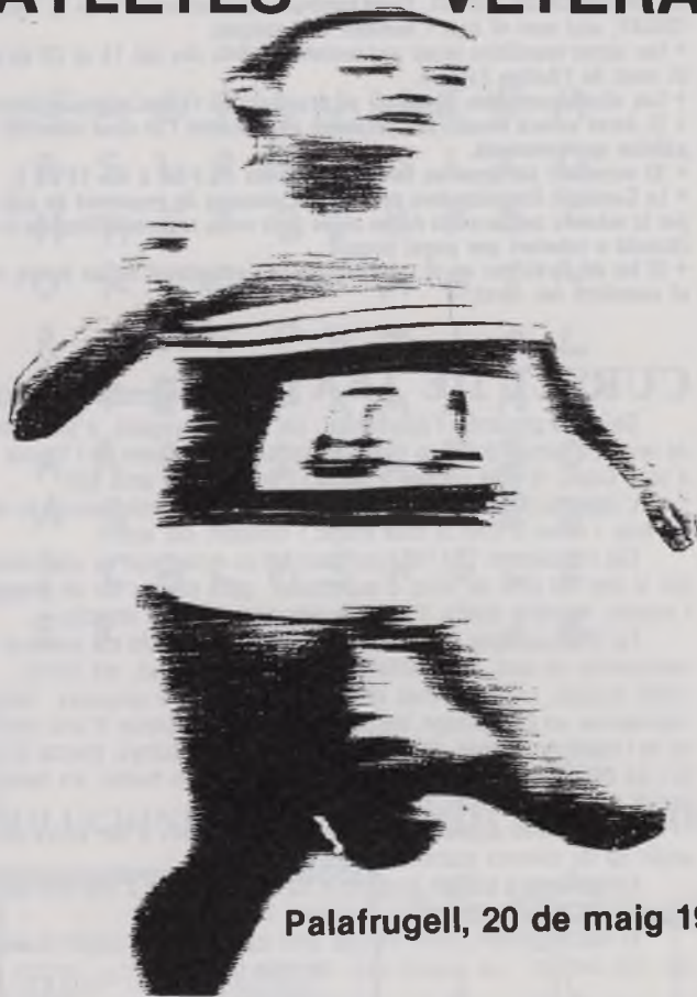
Palafrugell, 20 de maig 1989

Fa anys que les curses de llarga distància han deixat d'ésser un mite per a molts corredors, i a la nostra província se'n fan moltes, de tot tipus, però sense cap dubte de 100 kms. només aquesta.