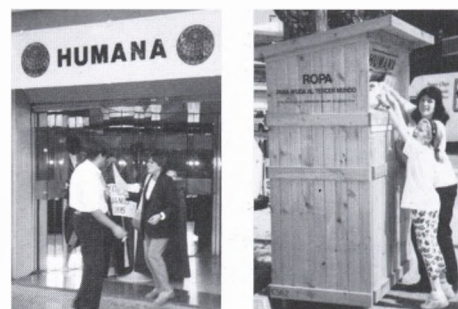
La botiga i el contenidor.

Els dos contenidors estan localitzats un a la plaça Forgas i l'altre al Portal d'en Paloma.