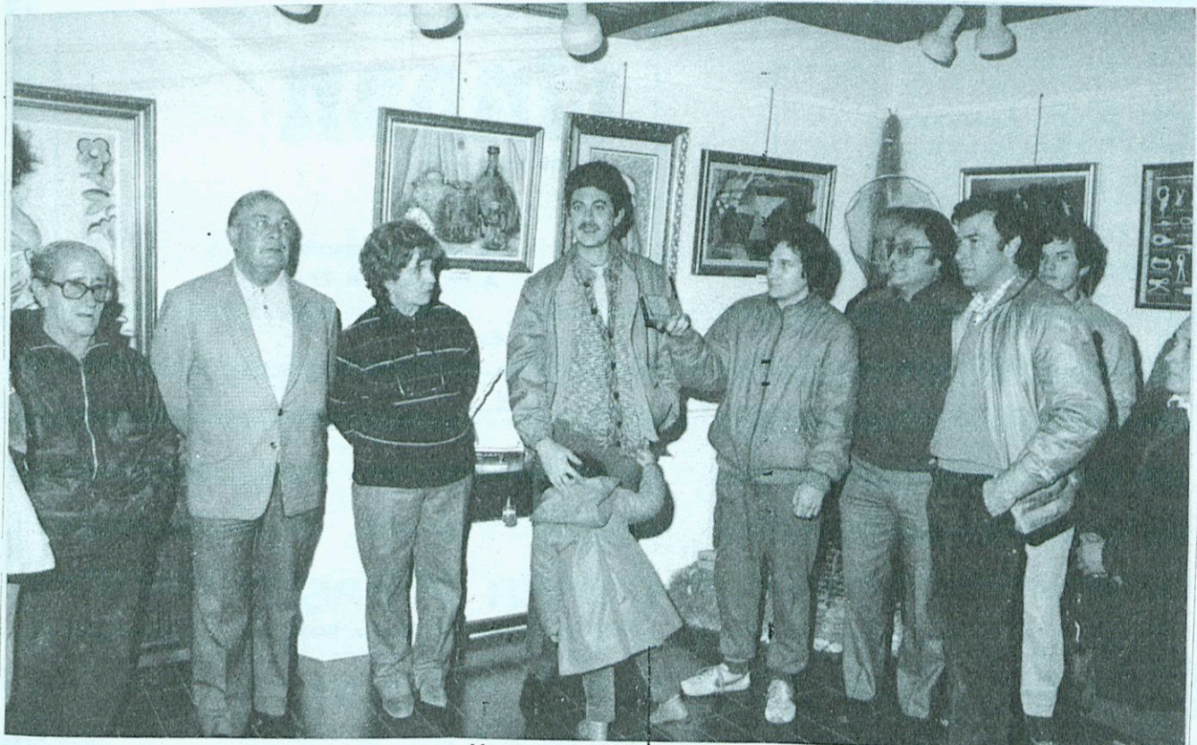
Un moment de la inauguració.