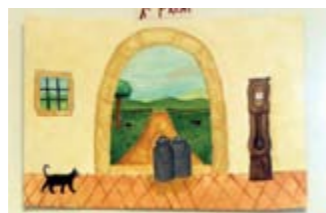
AFRA PASCUAL 1er Premi // JUVENIL