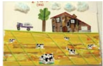
DIDAC PARLON 2on Premi // INFANTIL