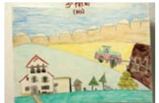
CARLES CORNELLÀ 3er Premi // INFANTIL