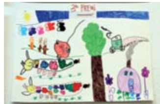
EMMA RABIONET 3er Premi // PETITS