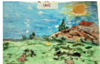
CRISTAL ALBIOL 2on Premi // INFANTIL