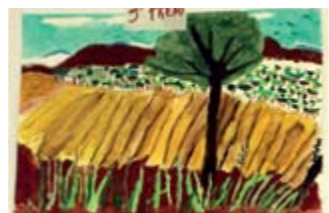
OLEG RIULLALLÓ 3er Premi // JUVENIL