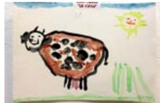
MÀRIUS TURON 2on Accèssit // PETITS