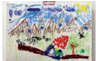
LAURA BERENGUER 1er Accèssit // PETITS