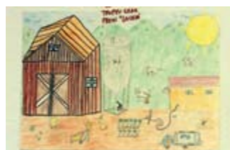
RAQUEL MIR Accèssit // JUVENIL