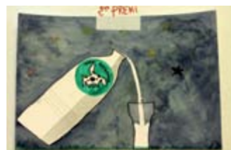
LLUC TÀSSIES 2on Premi // JUVENIL