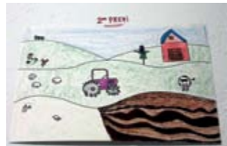
ALEXIA VEGA 2on Premi // PETITS

El passat dia 21 d'Octubre, en el marc de la Fira de la Llet, va tenir lloc l'entrega de premis del tradicional Concurs de dibuix de Sant Galderic. S'hi varen presentar 157 pintures, i tots els participants varen tenir una medalla i un plat commemoratiu de regal. Els guanyadors d'enguany, en les seves respectives categories, varen ser els que es mostren a continuació.