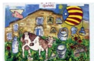
Mª CARME TARRÈS 1er Premi // ADULTS