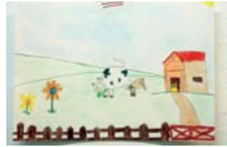
NÚRIA CORNELLÀ 1er Premi // PETITS

El passat dia 21 d'Octubre, en el marc de la Fira de la Llet, va tenir lloc l'entrega de premis del tradicional Concurs de dibuix de Sant Galderic. S'hi varen presentar 157 pintures, i tots els participants varen tenir una medalla i un plat commemoratiu de regal. Els guanyadors d'enguany, en les seves respectives categories, varen ser els que es mostren a continuació.