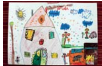
JORDI BOFILL 4rt Premi // PETITS