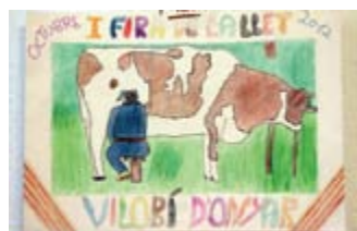
CRISTINA LLEAL 4rt Premi // JUVENIL