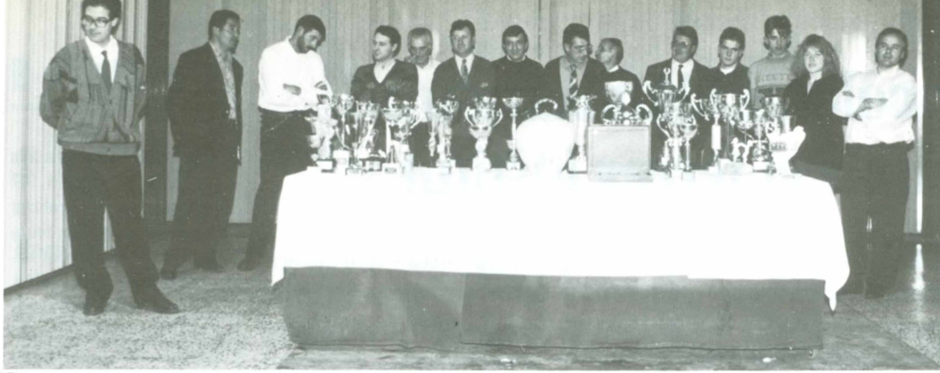
Alguns dels membres de Flor de Fajol el dia del sopar de l'entitat.

Cash Avui a les vuit del matí han entrat en servei les noves instal·lacions de Gros Mercat a Olot. Es tracta d'una gran superfície de 4.000 m 2 per a la venda a l'engròs d'alimentació i equips en general. Dimecres va tenir lloc la inauguració oficial, a la qual foren convidades més de 600 persones.