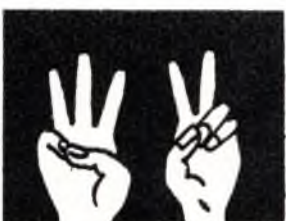
¡Quedan 5 minutos para terminar!