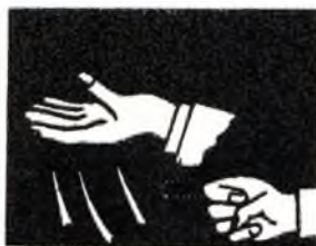
Ruidos ¡Más alto!