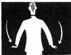
¡Terminar la acción! (Fondo de voces)