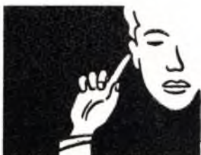
¡No se oye!