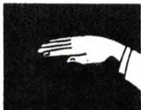
¡Mantenga el fondo musical! (o de sonido)