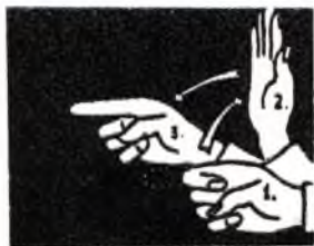
Ruidos ¡Atentos! ¡Empiecen!