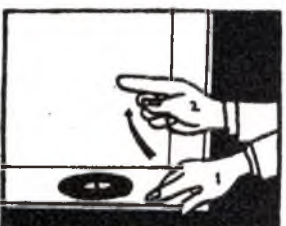
¡Tras este disco, empezamos!