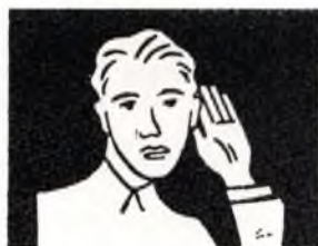
¿Qué tal se oye?