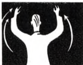
¡Comenzar la acción! (Fondo de voces)