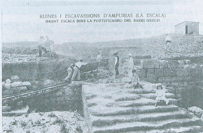
L'Hotel-Sanatori s'hauria trobat a dues passes de les Ruïnes d'Empúries, les excavacions de les quals es trobaven en ple creixement, aquella època.

Però com dèiem al principi, i tal com ho hem pogut constatar els escalencs de generacions posteriors, tot fou una il·lusió que només serví perquè aquella bona gent visqués uns dies sense pensar en les preocupacions diàries, que no eren poques, però que sabien suportar-les molt resignats.