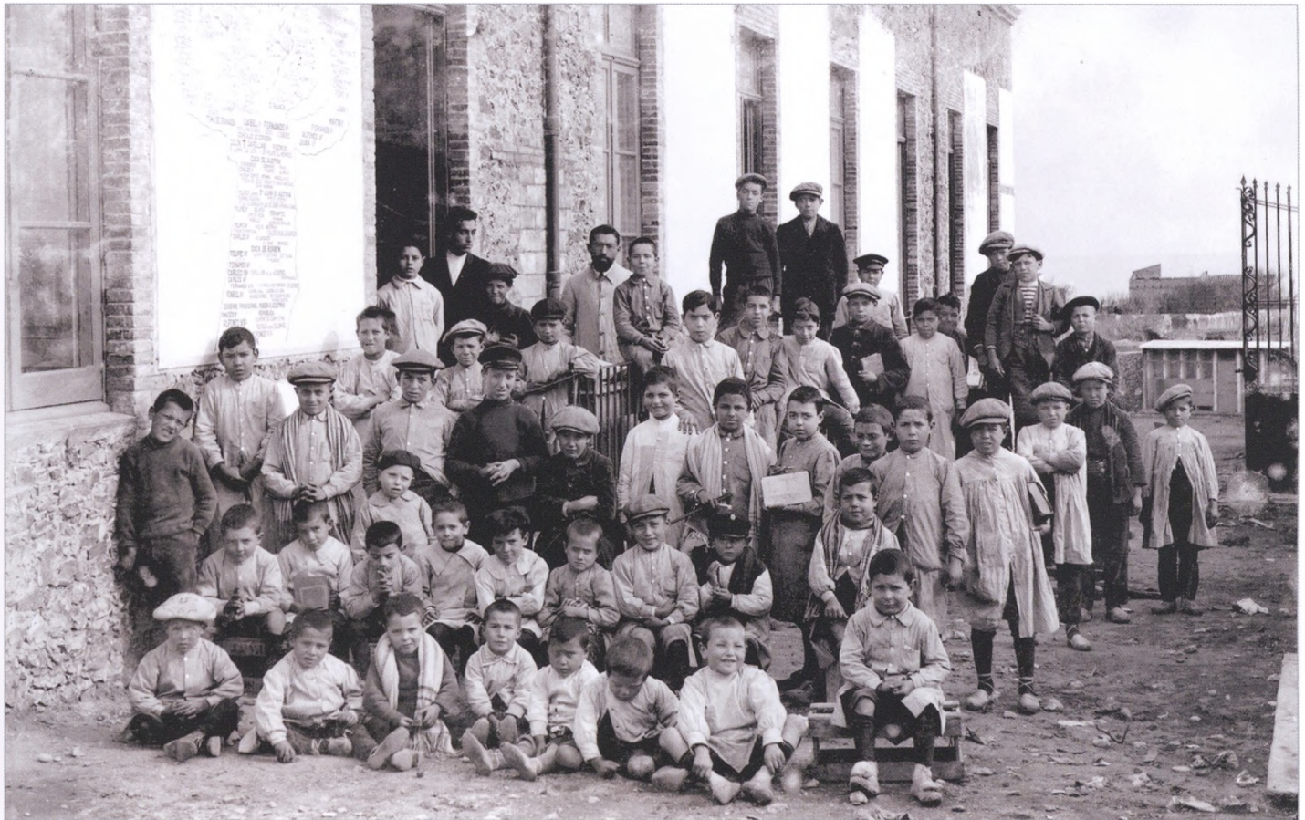
AHE. Curs 1915-16.

de 1916. Es concedia l'autorització a operar com a centre no oficial per alumnes de les edats compreses entre els 5 i els 12 anys.