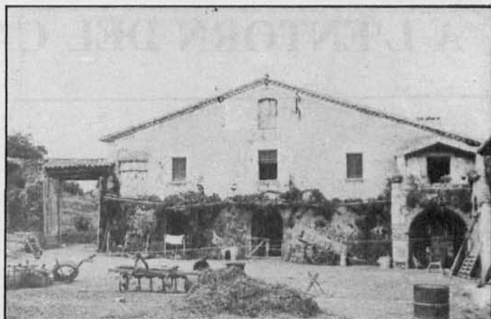
Can boades, any 1950.

Salitja, com a tota la Catalunya Vella, participa amb la revolta dels pasesos (Guerra dels Remenses), que en no cedir aquesta revolta, provoca que la Generalitat aixequi