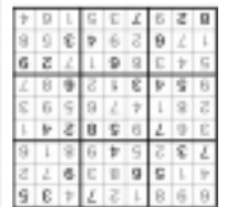
SOLUCIÓ AL SUDOKU