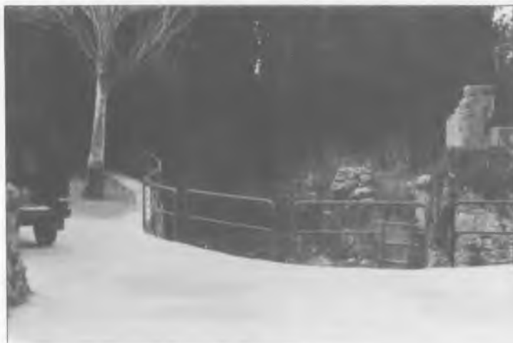
FONT GRAN — Aquesta obra s'ha realitzat en dues fases. Primera: reconstrucció del mur que fou enderrocat per les pluges de l'any 87. Segona: ampliació del mur fins a la finca veïna, formant una plaça d'aparcament per als usuaris de la font.