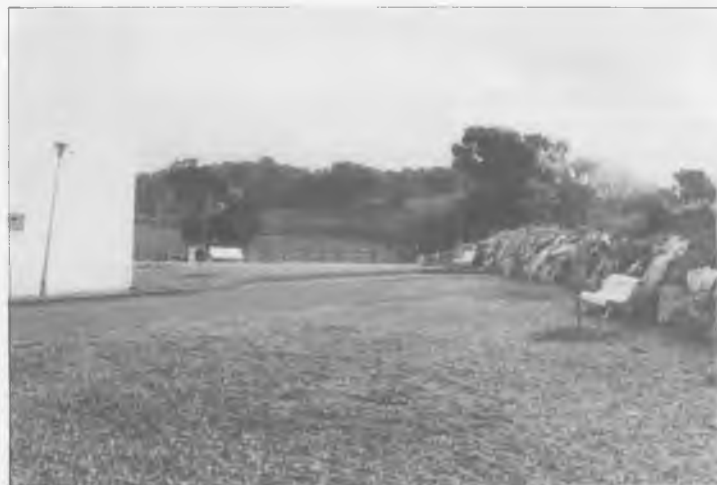
ZONA VERDA DEL VEÏNAT SANT JOSEP — Aquest és l'estat actual d'una zona que era un abocador d'escombraries, després de construir murs de contenció, rocalla, col·locar bancs i enjardinar la zona.