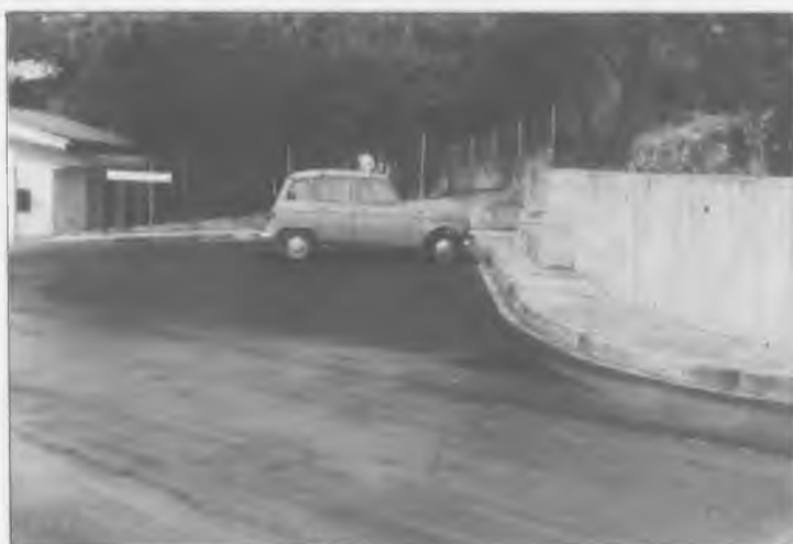
CARRER DE LES ESCOLES — Estat actual després de ser pavimentat, de fer un mur de contenció al camí que va al Camp de Futbol i construir-hi un banc d'obra.