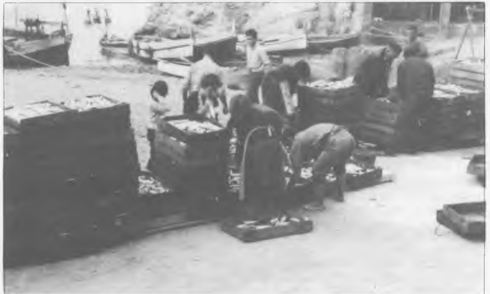
Arribada de la teranyina a la platja de Sa Riera. Any 1950.

Recordo amb enyorança la sorraneta, amb les tranynines i sardinals, les xarxes de cotó que tan feinosament teníem al «Catiu» (local de tots els pescadors, on teníem amb escorça de pi les xarxes), les barques grans amb els seus bots de llum com la «Carmen», la «Cala Moreta», el «Cap de Begur», des de les que pescàvem a la teranyina les saboroses sardines, berats, sorells i anxoves. Recordo també la pesca dels sardinals que eren xarxes calades a la deriva de «prima» i de «matinada» i que va portar gran progrés a la cala amb les subhastes de peix i la indústria del «salazón» en els coneputs salins. Era un golf molt apreciat anomenat «golf de plata» per les bones captures que si feien.