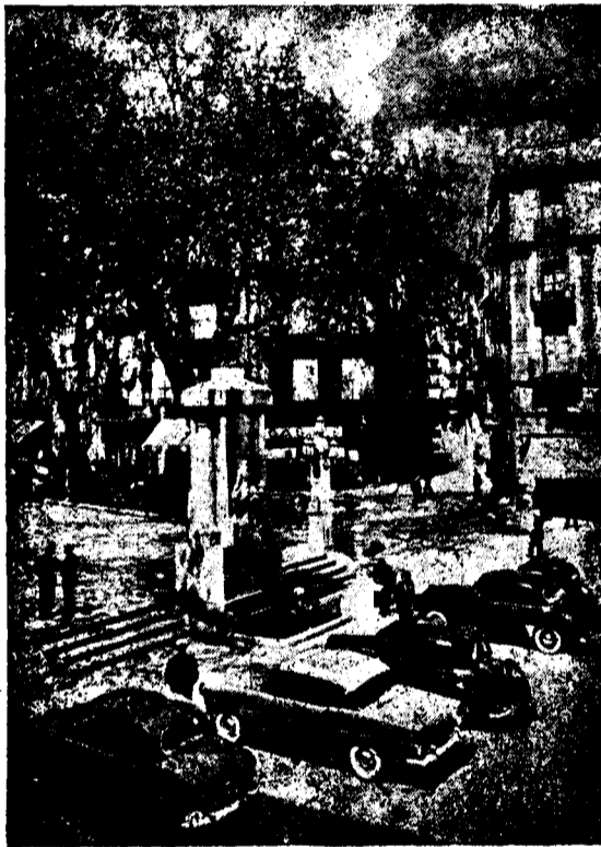
Monumento a Monturiol en la Rambla de nuestra Ciudad.

El mismo proceso siguió Isaac Peral con su famoso subacuático, que tuvo su momento de apoteosis. Pero nadie puede negar que corresponde a España el primer atisbo de la navegación submarina, que acaba de llegar a la cúspide con la reciente hazaña del comandante Anderson, navegando bajo el casquete ártico a bordo del «Nautilus» atómico, que bien pudo bautizarse con el nombre de Monturiol.