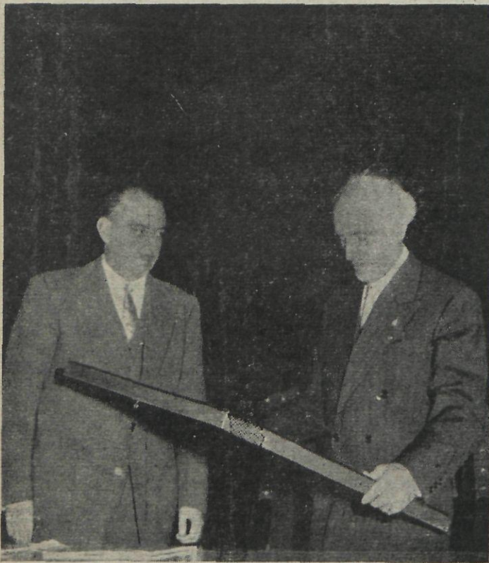
El Presidente de la Diputación de Gerona y el escultor Marés, en el homenaje que Port-Bou ofreció a su hijo predilecto.

Por encima de la anécdota menuda, del pequeño interés egoísta, del propósito limitado, del esperado turista estival, nos parecía ver flotando en el aire como un hamletiano dilema que afectaba por igual a presentes y ausentes el ser o el no ser futuro de la ciudad y su capitalidad, hoy discutible igualmente tantas otras cosas antes miradas como definitivas.