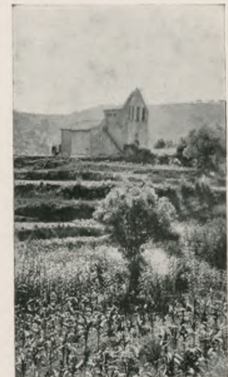
CANYAMARS. — L'església.