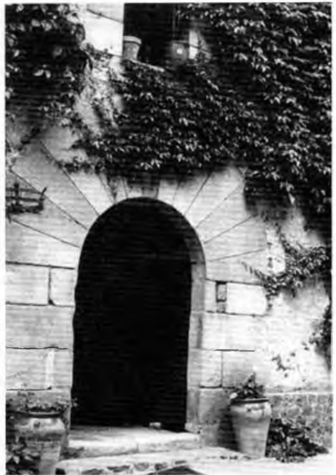
Entrada principal de la Torre.

La mateixa estructura relacional de caràcter ampli d'aquestes cases benestants feia que apareguessin rela-