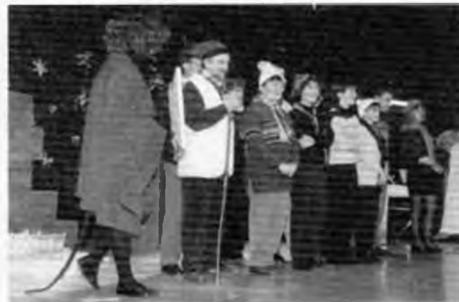
Fins i tot els mestres i els pares van cantar!