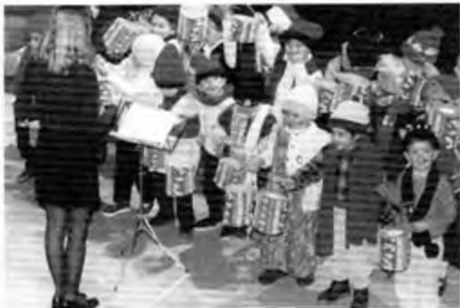
El dia 22 de desembre, els nens i nenes del col·legi Sant Iscle vam anar al Casino a cantar nadales.