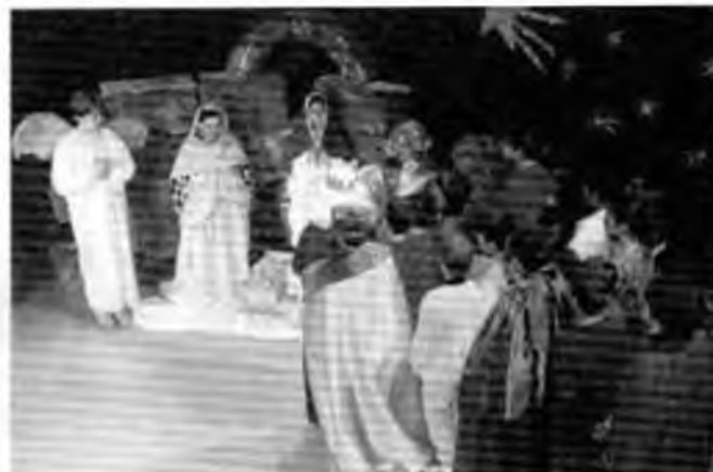
Sant Josep, Verge Maria, àngels i de Reis Mags d'Orient.