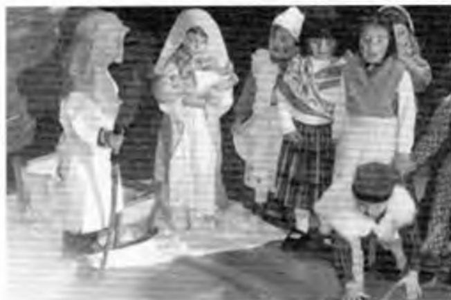
Anàvem disfressats de pastors...

LA JUNTA DE L'APA DEL COL·LEGI SANT ISCLE