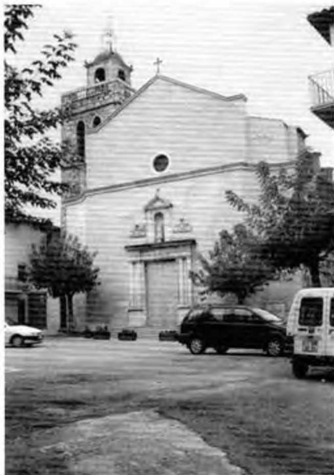
Aspecte actual de l'església i la plaça.

El 1999 ha fet 200 anys que es va beneir l'actual església de Vidreres. Entre els anys 1790 i 1800 es construí l'edifici de l'actual església. Aquest es bastí sobre l'antic, del qual només en queda potser part de l'actual campanar i la portalada, així, el 1650, quan s'acordà fer la portalada de l'església parroquial de Caldes de Malavella, el model a seguir era el de l'església de Vidreres. Actualment es pot comprovar que les portalades de Vidreres i Caldes de Malavella són idèntiques, amb petits detalls de variació.