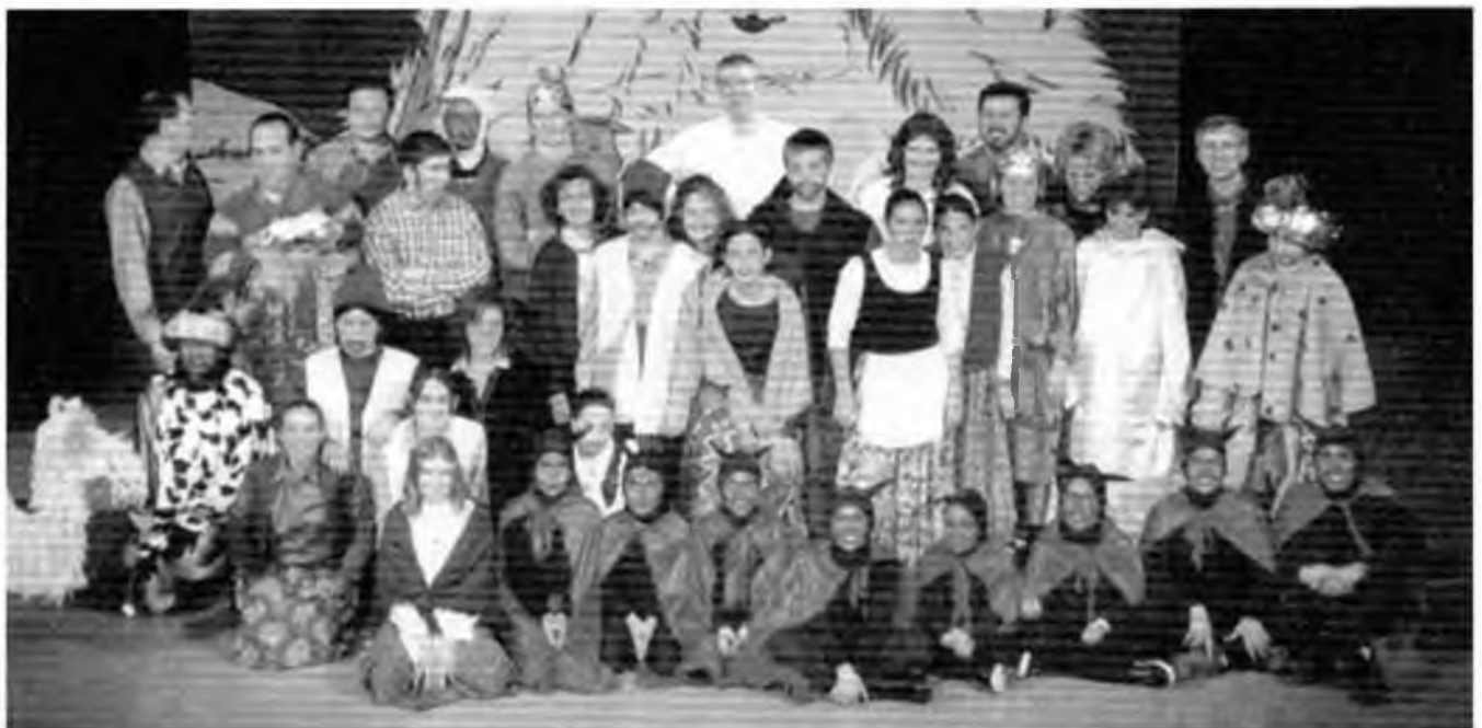
Actrius, actors i secció tècnica: el teatre és un treball d'equip.