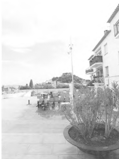
La plaça Forgas