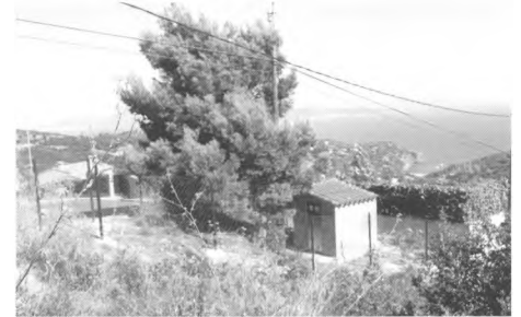
Nou reemissor de TV per donar cobertura a sa Riera