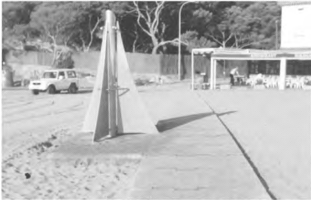
Nova passera i dutxes a la platja del Racó