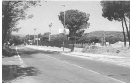
Vorera en el sector del camp de futbol