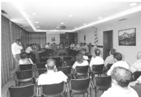
Constitució del nou ajuntament

•S'aprova per unanimitat el Compte General del Pressupost 2002, previ informe favorable de la Comissió Especial de Comptes de 15/04/03. Els comptes del 2002 presenten un romanent de tresoreria positiu (superàvit) de 772.600 euros.