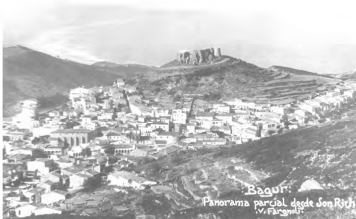
En aquests moments es porten digitalitzades 400 imatges

Amb aquests nous suports òptics s'obre un ampli ventall d'avantatges: es poden emmagatzemar grans quantitats d'imatges amb una gran facilitat d'accés i de recuperació; la reproducció és senzilla i no es pateix cap mena de pèrdua de la qualitat; davant d'una sol·licitud externa es pot trametre electrònicament una imatge i, sobretot, es pot garantir una millor conservació de les imatges originals.