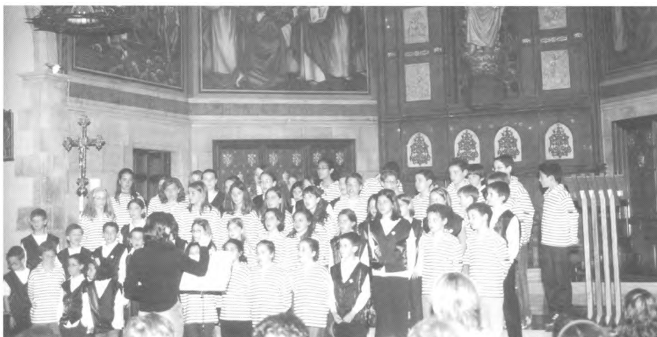
Cantada a l'església de Sant Pere amb la coral d'Argentona