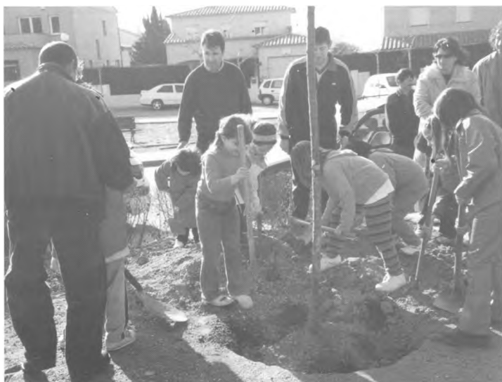
Festa de l'Arbre a Esclanyà, davant del Polivalent. 16 de març de 2003