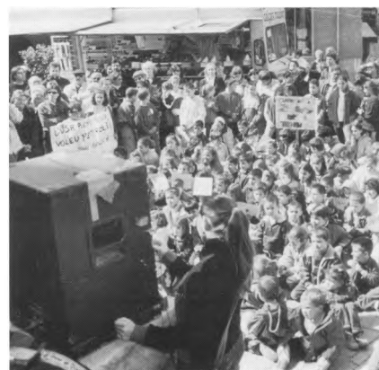
Begur i els seus escolars diuen "No a la guerra"