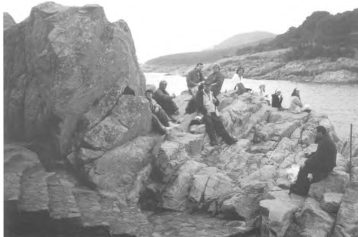
12a Caminada a d'Esclanyà a Tamariu. 30 de març de 2003