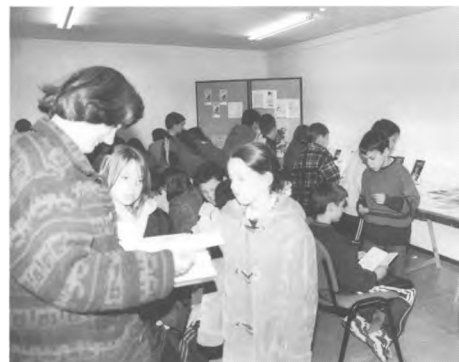
L'escola Dr. Arruga ve a mirar les exposicions de llibres.

els vostres fills i vosaltres mateixos gaudiu d'aquest espai.