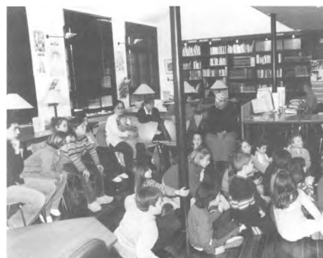
L'Hora del Conte.