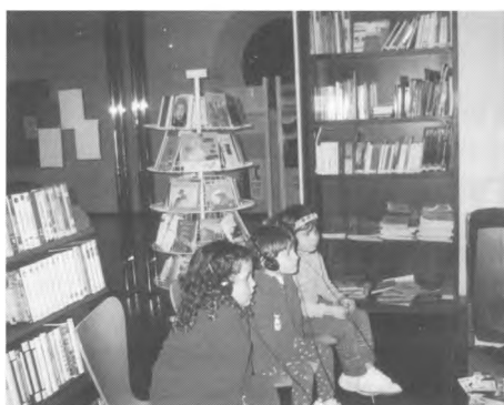
El VD també té el seu lloc a la biblioteca.

Per Nadal ens divertíem fent l'estrella per a l'arbre i una felicitació per als pares.