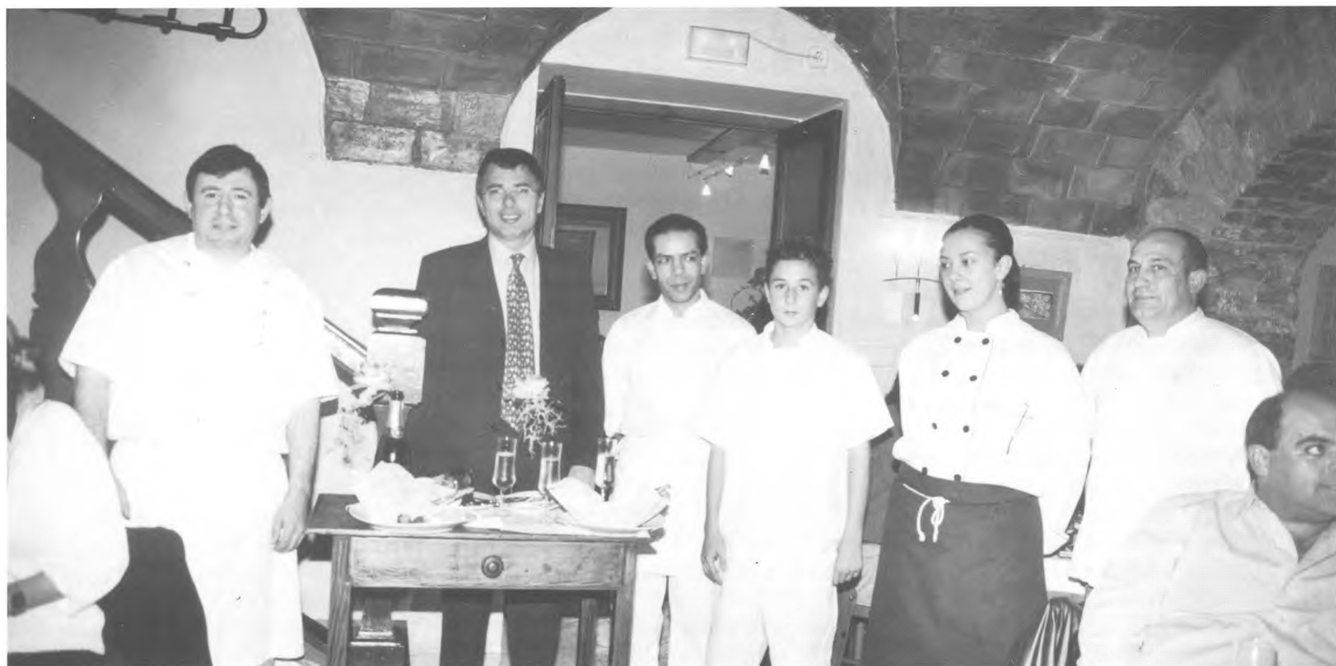
L'alcalde de Begur a la Fonda Caner el dia de la presentació.