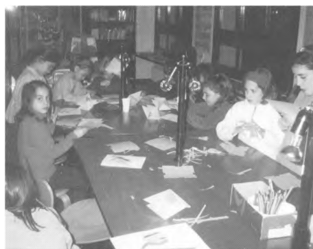
Tenim bona estrella. Activitat de Nadal.