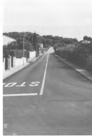
Asfaltatge d'urbanitzacions per valor de 60.000.000 de pessetes.