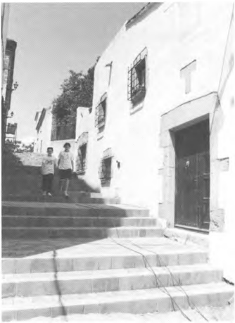
Arranjament del carrer Clos i Pujol.