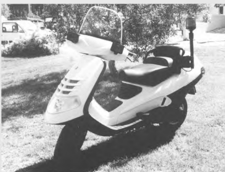
Adquisició d'un nou vehicle