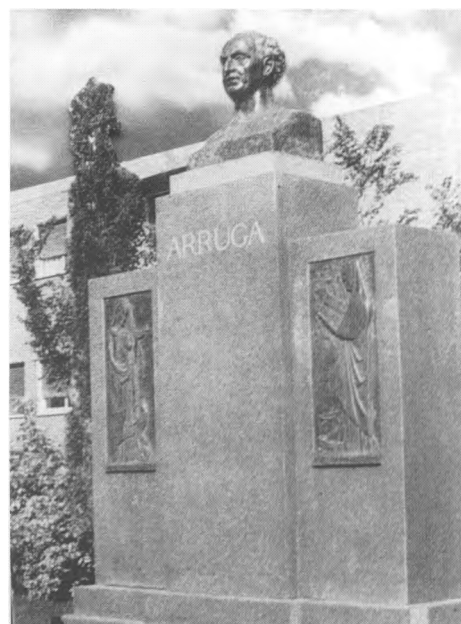
El monument, a Madrid.

(3) A la Guia urbana de Barcelona , edició 1981-1982, hi figura l'"Avenida Doctor Hermenegildo Arruga". Era una avinguda en projecte, paral·lela a l'avinguda República Argentina, entre els actuals carrers de Gomis i Esteve Terrades. No fou construïda, ni figura en successives edicions de la Guia ( Nemo propheta acceptus est in patria sua ).