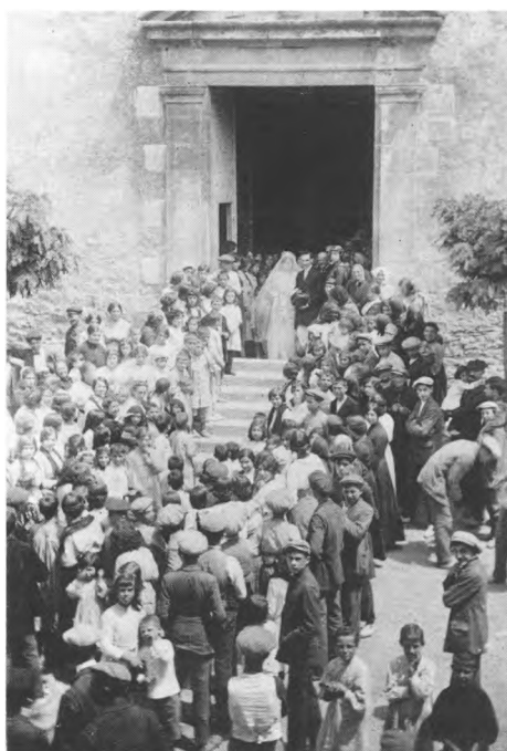
Els nous esposos eixint del temple.

Metòdic, era d'una self-discipline inflexible, d'una puntualitat suïssa. Era exigent, sí. Però, qui podia reprotxar-li, si amb ningú fou tan exigent com amb ell mateix?