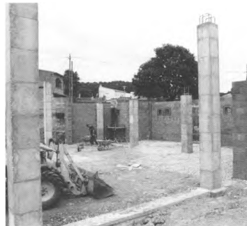
Inici de les obres de la nova Sala Polivalent d'Esclanyà.

Així mateix, Frigola ha fet donació a la llar d'infants Ses Falugues de Begur de cinc quadres de ceràmica amb motius infantils. Li agraïm ambdues aportacions.