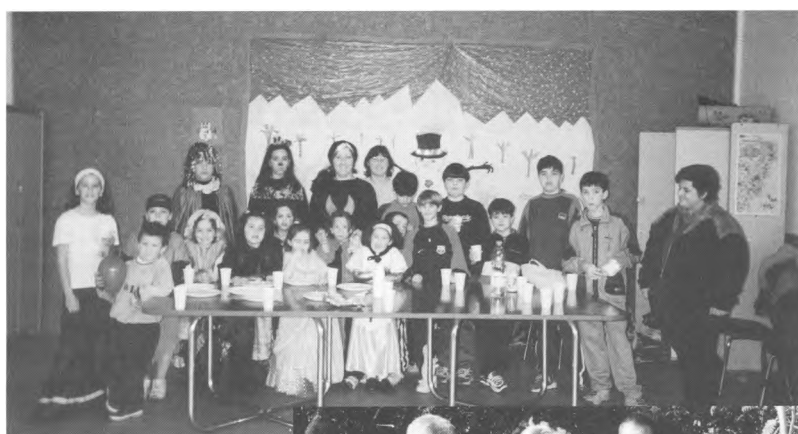
Animació infantil: Carnaval. (17/02/01)

He deixat per al final l'"Espai de Joc: relació pares/mares-fills/filles", que són uns tallers de música, de contes i de massatges per a mainada de fins a 6 anys amb la participació dels seus pares i/o mares. Tal com el nom indica, en aquests tallers el que es vol potenciar és la relació entre pares i fills. Alguns s'han fet a Begur i d'altres a