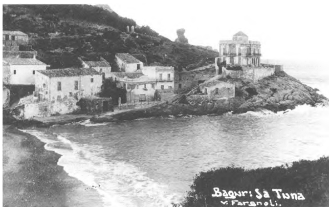
Begur: Sa Tuna V. Farnol