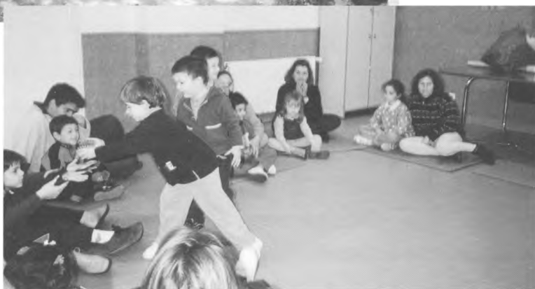
Espai de joc: Relació pares/mares - fills/filles. Taller de música. (nens i nenes de 3 a 6 anys).

Esclanyà, intentant buscar el lloc més adequat. Es tracta d'un projecte del Consell Comarcal al qual l'Ajuntament de Begur ha donat el seu suport, però que no s'hagués pogut fer realitat si no s'hagués comptat amb la col·laboració, totalment desinteressada, dels mestres i de l'AMPA de les escoles L'Olivar Vell d'Esclanyà i Dr. Arruga de Begur, i de la llar d'Infants Ses Felugues, així com del pediatre i la infermera de l'ambulatori de Begur. Sé que en algun taller hi ha certs contratemps, però suposo que les primeres vegades són això, la inexperiència i no tenir-ho tot previst. Malgrat aquests entrebancs, els tallers en general han funcionat, han agradat i crec que han sigut molt enriquidors tant per als pares i fills com per als professionals que hi han participat.