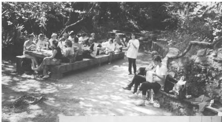
7a Caminada Popular. Font de la Teula - Llofriu. (29/04/01)