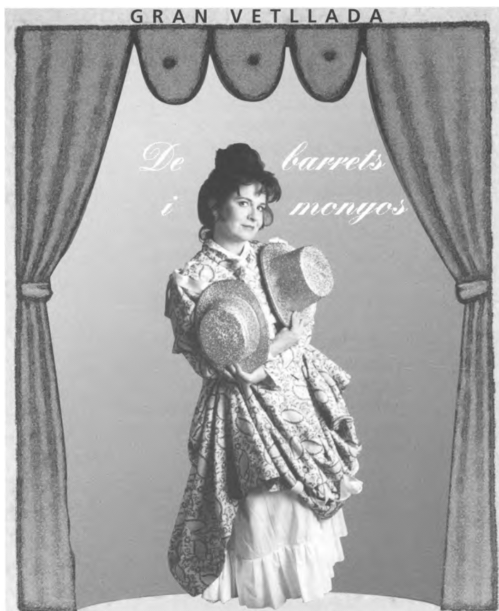
Amb la gran vedette internacional del Prat de Llobregat Ernestina Bravo

I ara, gaudim amb la formidable Ernestina Bravo!