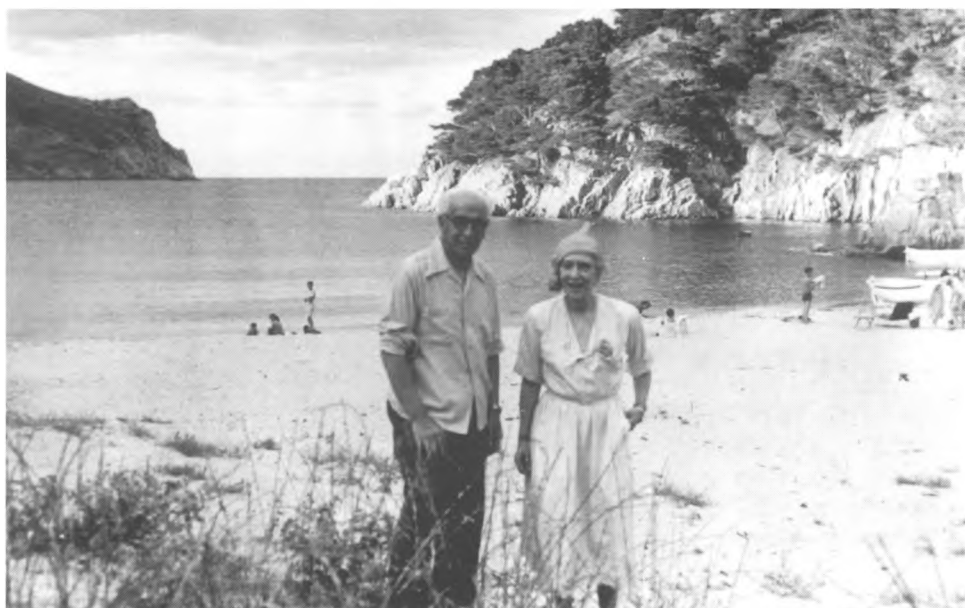
Amb la reina Elisabet, a Aiguablava.