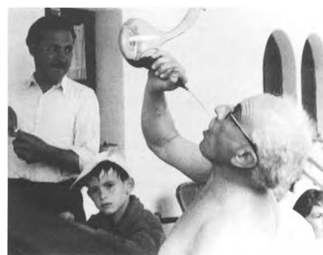
Al xiringuito d'Aiguablava.

(1) "Només mereixen la llibertat i la vida aquells que cada jorn les conquereixen amb llur esforç". (En la nostra postguerra, però, tingué més adeptes la dita anònima: "La ociosidad es la madre de la vida padre").