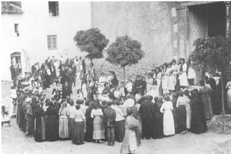
La comitiva dirigint-se a l'església.

Com digué un dels seus biògrafs, no afalagava el client; ni per això, ni per publicitat ni cap tracamanya veié un sol pacient. I a fe que visqué aclaparat per malalts, la majoria casos difícils. Singularment afectuós amb els que sofríen, els afligits i els desgraciats, era sorrut amb els amoixadors i els petulants. L'eminent oftalmòleg Galo Leoz, gran amic seu, opinava que Arruga era, a més d'un sentimental, un gran tímid. Un dia descobrí, però, que un miquel, un xiscle o una exhibició d'aspror constituïen una excel·lent cuirassa contra els corcons. Era un blindatge de sorrut, que encobria, però, una bondat generosa, una ànima sensibilíssima.