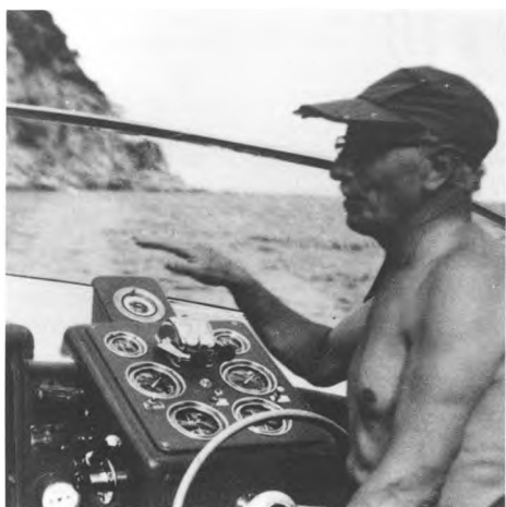
Al volant d'una de les seves "joguines".

rrers, on no la coneixien, car, fatigada per les contínues formalitats protocol·làries, com es trobava millor era passant desapercebuda. Un dia, tornant amb el meu pare d'un d'aquests passeigs, el motor començà a fer figa. S'aturaren en una estació de servei. El meu pare baixà del cotxe; la reina restà dins. De sobte, el diligentíssim mecànic, abans que el meu pare tingués temps d'advertir-li que dins de l'automòbil hi havia una senyora, elevà el vehicle. La reina es divertí molt amb la insòlita, i per a ella nova, experiència.