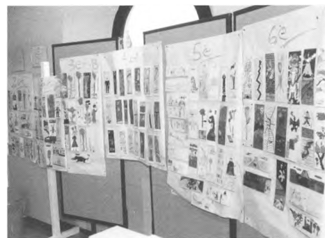
Exposició dels punts de llibre presentats al concurs.

El concurs va ser molt reeixit i hi van participar tots els alumnes de les escoles Dr. Arruga (Begur) i L'Olivar Vell (Esclanyà), a les quals donem les gràcies per la seva col·laboració.