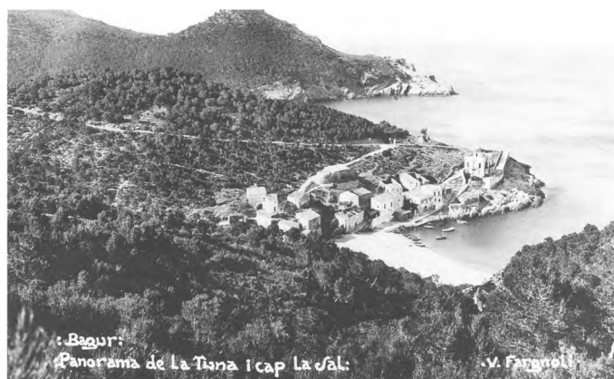
Begur: Panorama de La Tuna i cap La Sal