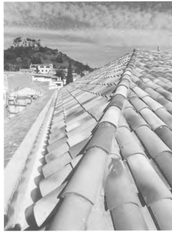
Arranjament de la teulada del Casino Cultural.