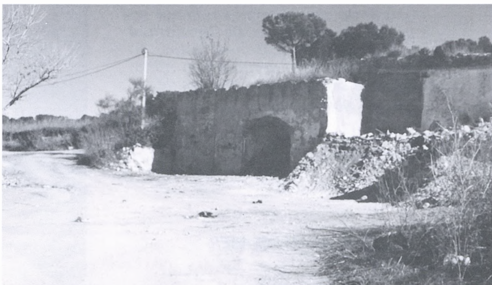
S'ha retirat la runa del barri del Forn de la Calç.