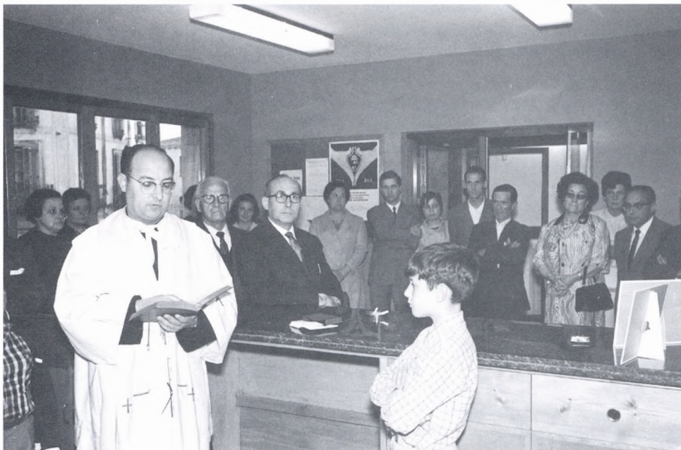
Inauguració de la Caixa de Girona, l'any 1968.

Al començament de la postguerra, i ja amb l'Ajuntament instal·lat a can Matilde des de la revolució, tot el poble volia que s'enderroqués la casa de la Vila Vella i que s'engrandís la plaça, fins a la carnisseria de can