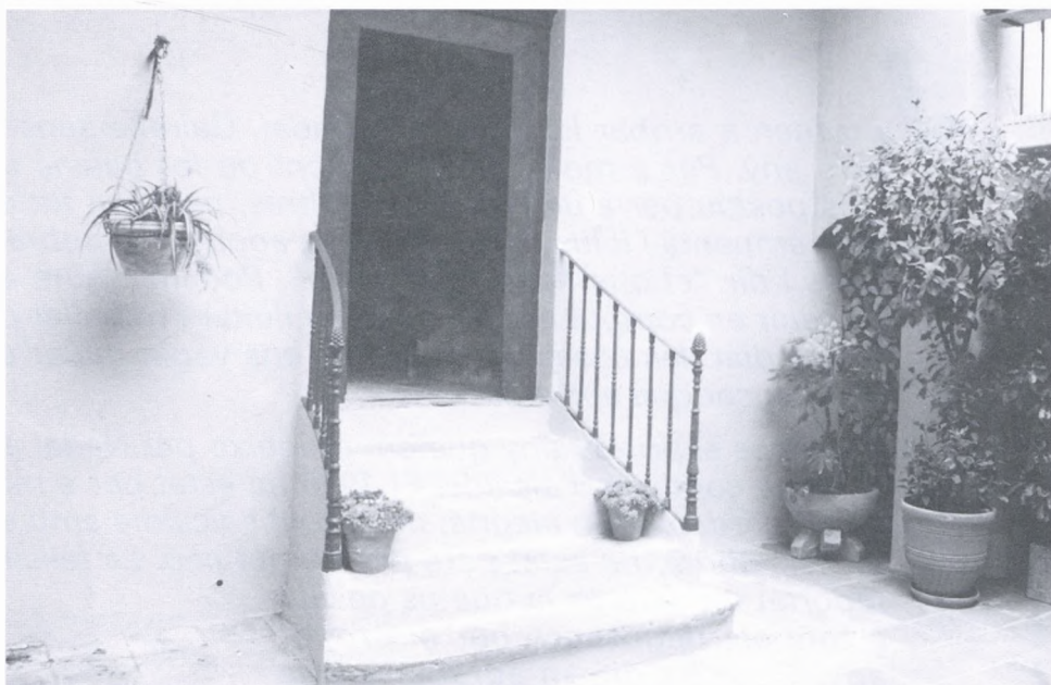
S'han acabat definitivament les obres a l'Hospital de Sant Carles.