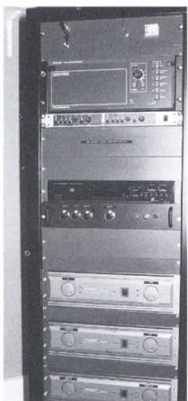
El nou aparell de sonorització

Ens plau oferir una bona notícia que fa referència al nostre cinema, en aquest any en què commemorarem el centenari del cinema. El cinema de Begur ha començat una nova etapa amb la recent instal·lació d'un projecteur de qualitat i l'adequació als nous temps, i també la