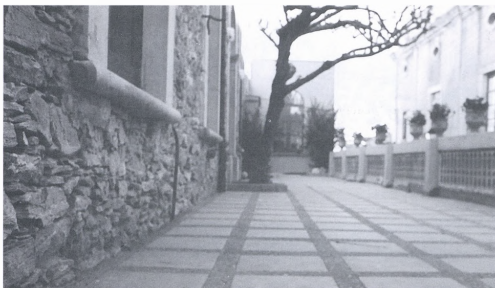
S'han efectuat diverses obres de millora i manteniment en el Casino Cultural.

Recordem que les pàgines d' ES PEDRIS LLARG són obertes a tothom. Qualsevol persona que vulgui emetre llur opinió o col·laborar en la revista ha de lliurar els originals a la Redacció, fent-hi constar les seves dades personals i el seu telèfon, sense que això suposi cap compromís de publicació dels articles que no s'hagin sol·licitat expressament.