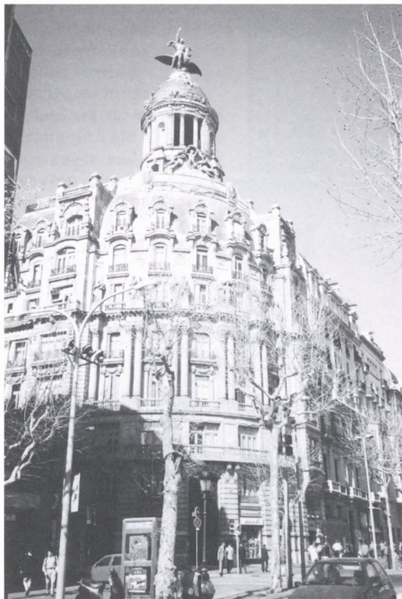
Edifici de "La Unión y el Fénix", situat al passeig de Gràcia cantonada carrer Diputació, de Barcelona, i construït el 1927.