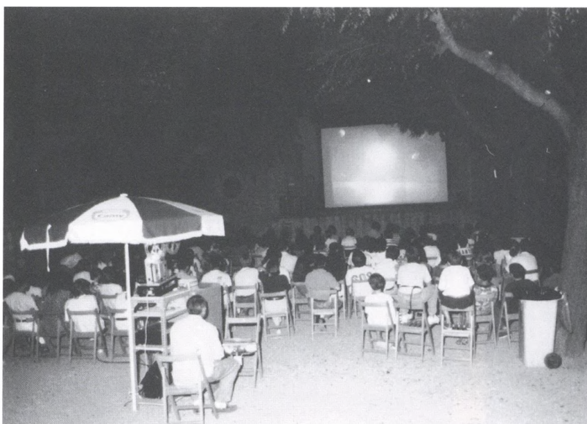
El pati de les Escoles Velles és un marc ideal per a les nits d'estiu amb cinema

El proper 3 d'octubre us esperem a tots per inaugurar el nou cicle de cinema; acabada la projecció us oferirem un refrigeri per celebrar-ho. No us ho perdeu! Us hi esperem!