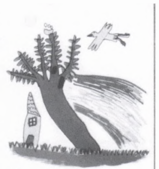
I m'han posat per nom C. P. L'OLIVAR VELL.