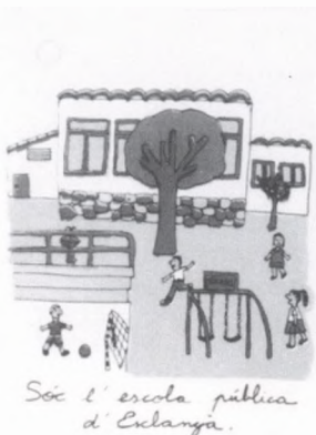
Sóc l'escola pública d'Esclanyà.

Des d' Es Pedris Llarg volem agrair a tots els assistents la seva participació, i, molt especialment, la de tots aquells que han confiat en la qualitat d'ensenyament que es pot oferir des d'una escola pública rural com L'Olivar vell.