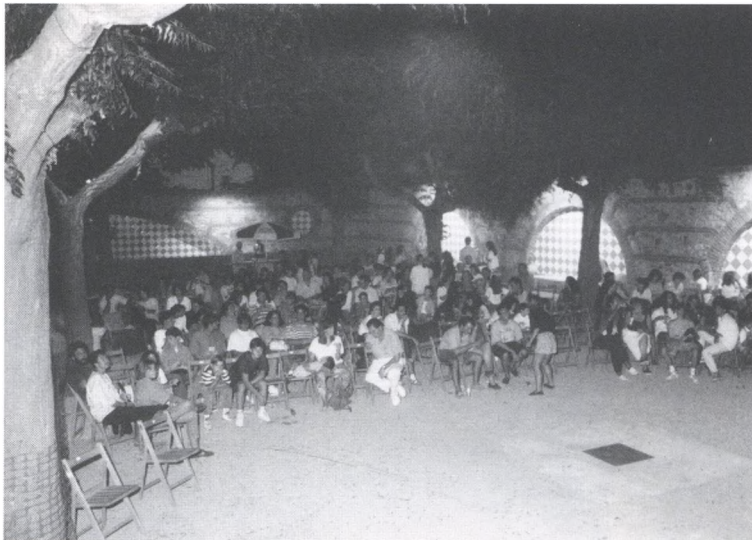
El públic va respondre meravellosament a les projeccions de cinema al carrer.

El propassat 20 d'agost finalitzava a Begur el cicle de Cinema al carrer, temporada molt exitosa socialment i econòmica.