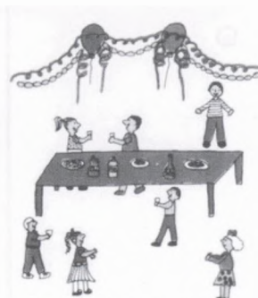
M'han batejat el 14 de juny de 1992.