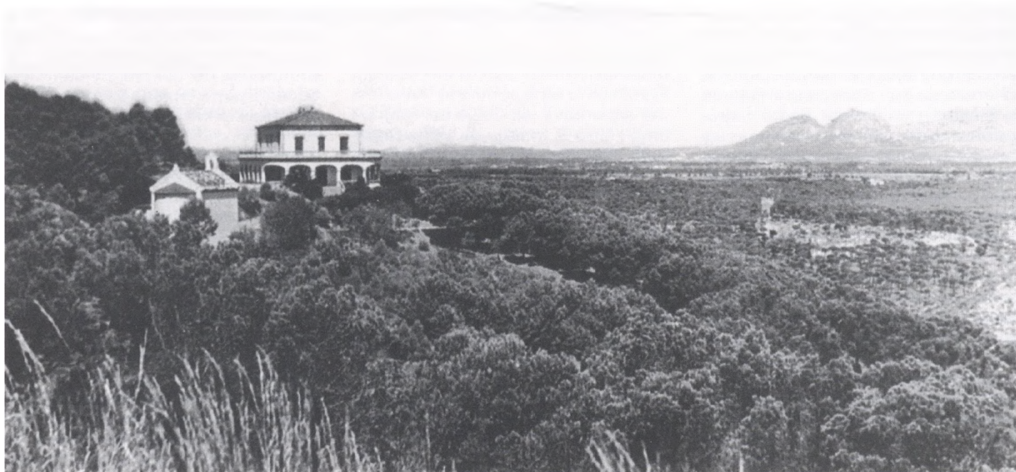
La casa de Pere Coll i Rigau abans d'edificar-se noves cases al seu voltant.