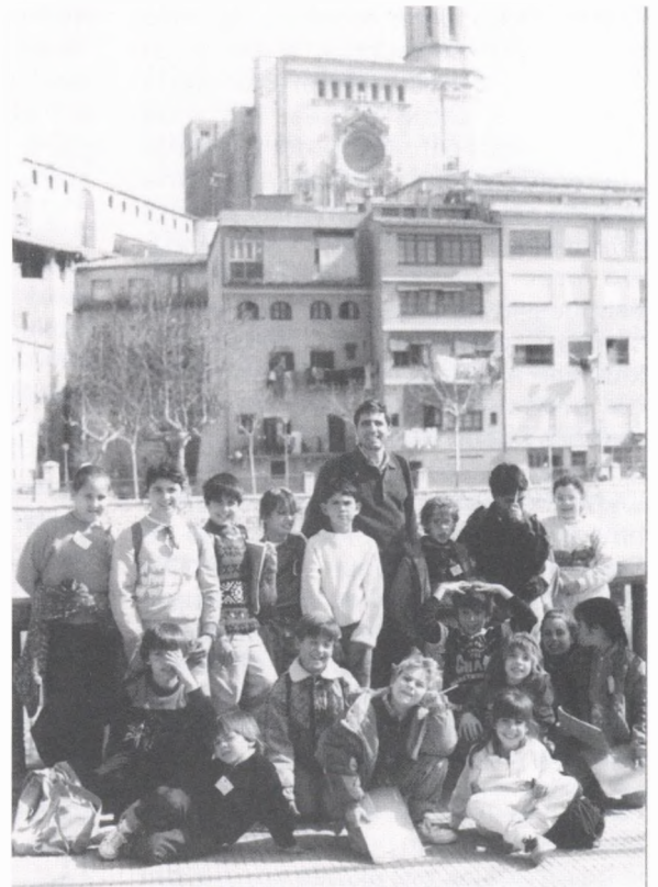
Alumnes que van començar el treball amb el mestre, en una excursió a Girona.

La festa va continuar amb el lliurament de premis del concurs per