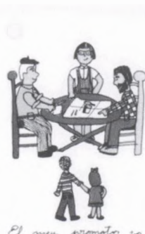
El meu promotor va ser el senyor Sebastià Català.