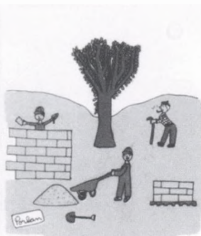
baig neïsser per allà el curs 1968-69.