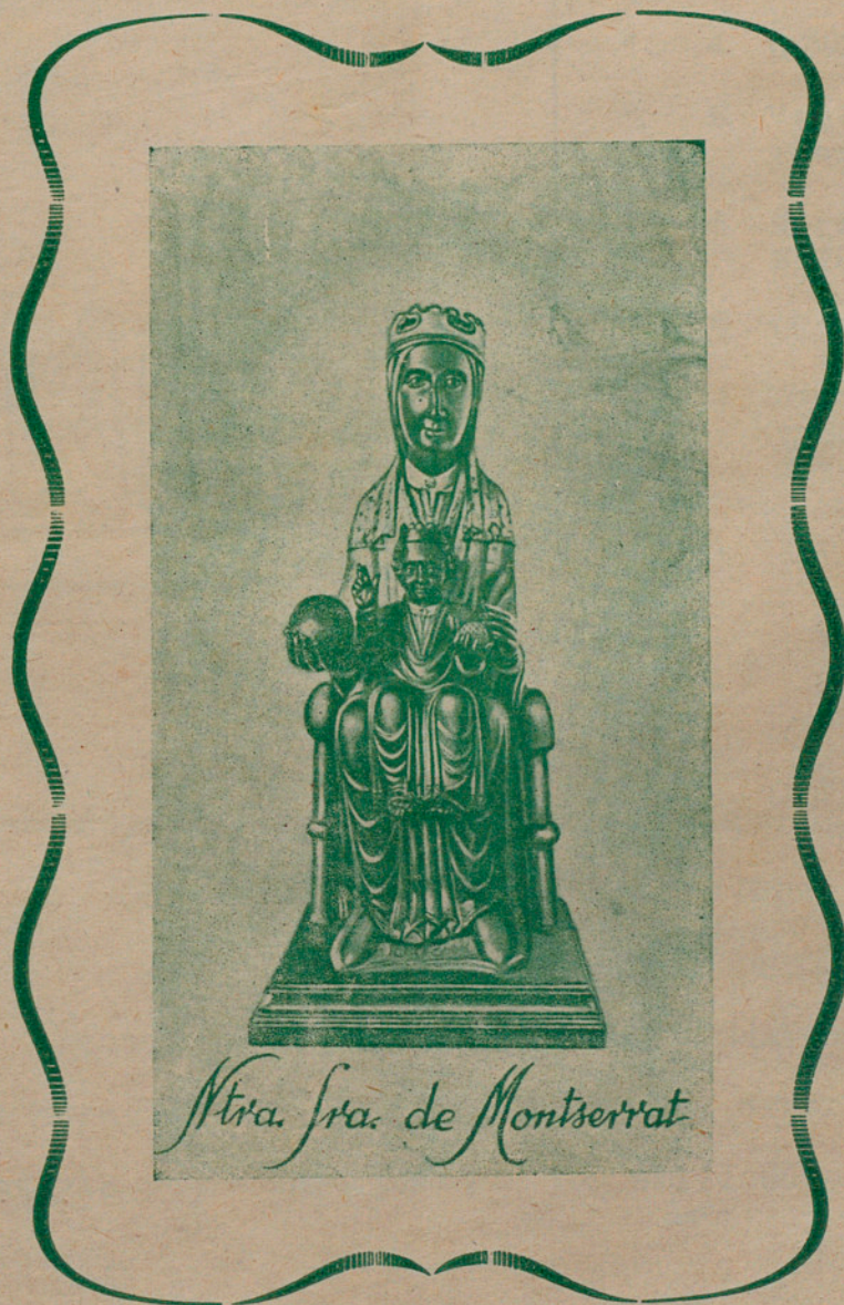
Ntra. Sra. de Montserrat