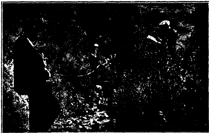
Elements de la «U. E. C. : Olot» marcant el camí de Sant Miquel del Mont.

En aquest nostre primer número saludem a tots els aimants de l'excursionisme, a la Directiva de la «U. E. C. : Olot» i socis, posant-nos a la seva disposició per el que calgui en pro d'aquesta trascendent manifestació de l'esport.