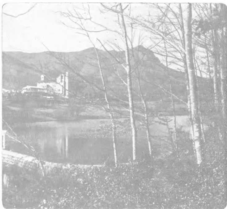
Presa de Santa Fe de Montseny